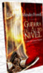
Guerra de Alto Nivel

Pronto: Dos asombrosos Libros Revisados y Aumentados