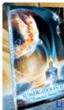
Libro Por Emerson Ferrell