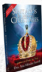
Sentados en Lugares Celestiales